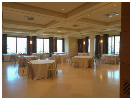
Centro Congressi Kursaal: ingresso, Sala Titano, Sala espositiva + bar/ristorante